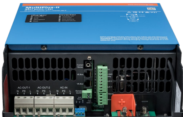
Área de Ligação